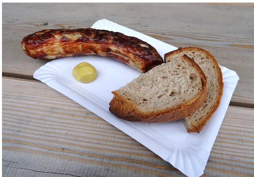
Vorgeschmack auf die 1. August-Feier